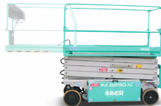
Extensie platforma 1.3 m.